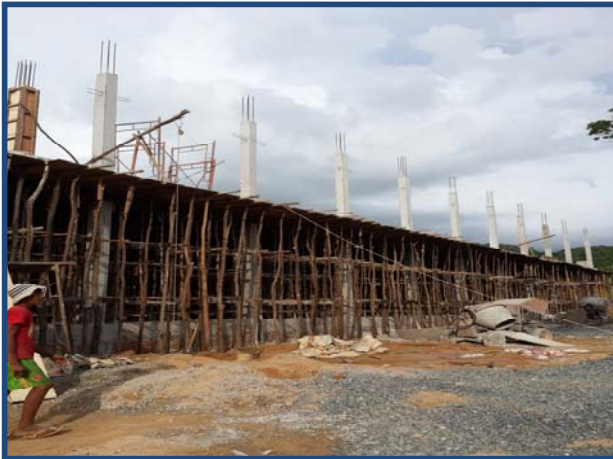
ការងារបេតុងសរសៃ Concrete Columns works