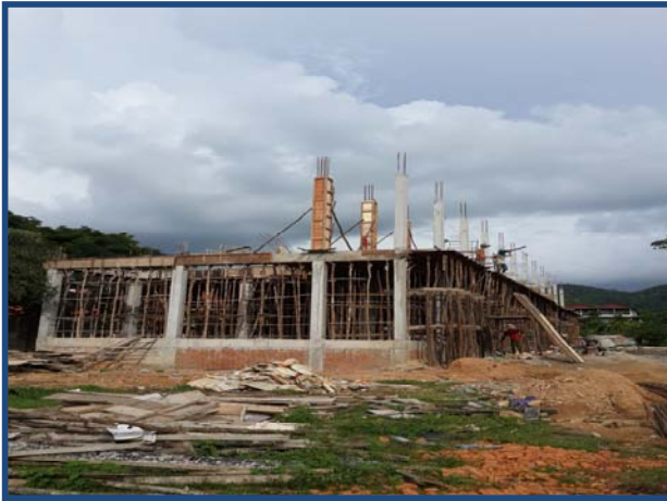
ការងារតម្លើងពង្រីក និងកំរាល Beam & Floor Form works