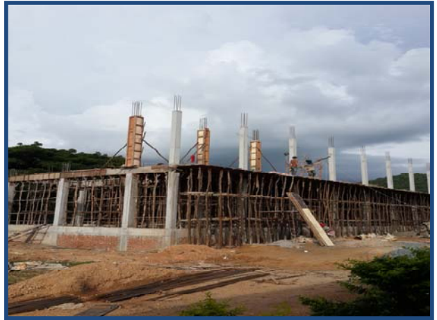
ការងារតម្លើងពង្រីក និងកំរាល Beam & Floor Form works