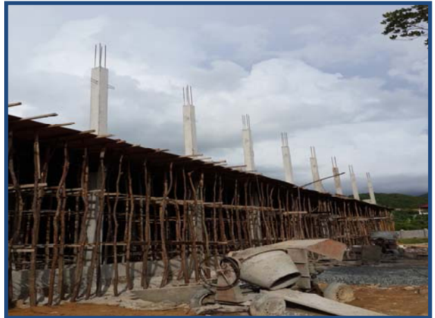
ការងារបេតុងសរសៃ Concrete Columns works